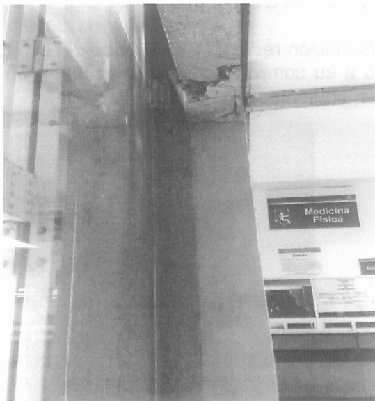
Desprendimiento de aplanados