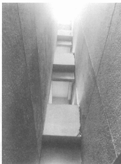
Separaciones de algunas juntas constructivas