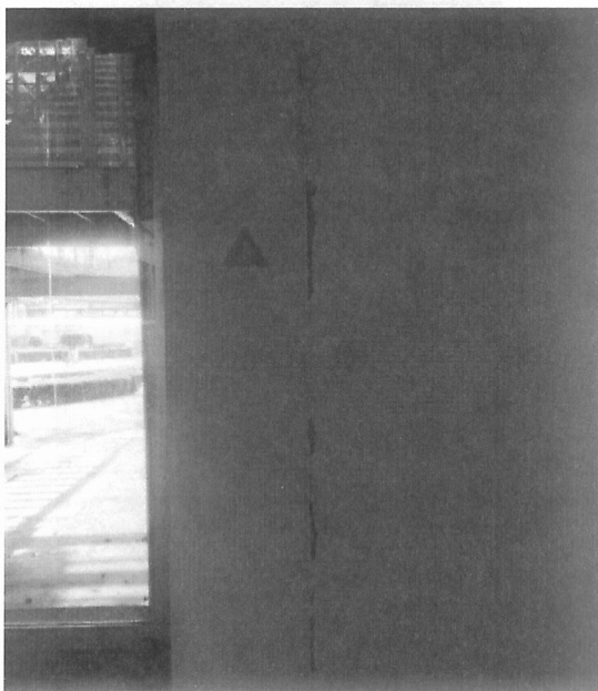
Grieta en junta constructiva, derivada de acabados continuos, sin respetar dicha junta