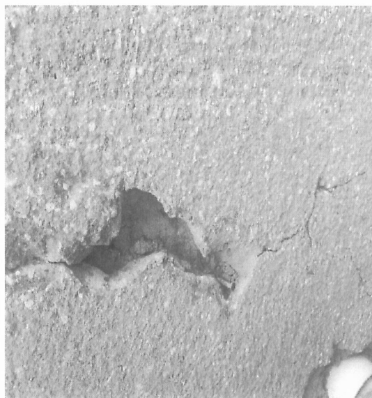
Grietas sin afectación de muros de soporte