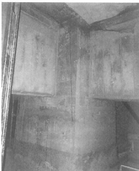
Estructura robusta sin daños

Es importante mencionar que este tipo de información recabada, será parte del expediente, lo que permitirá coadyuvar a darle seguimiento a su comportamiento estructural y en su caso programar los trabajos de rehabilitación correspondientes.