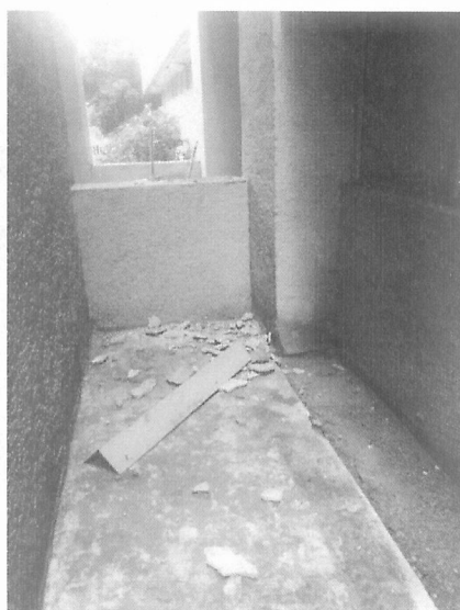
Desprendimiento de tapajuntas