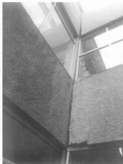
Separaciones de algunas juntas constructivas